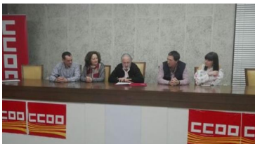
Página 2 y 3. Renovación sindical en CCOO Aragón