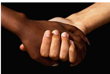
Página 5. Día Internacional contra el racismo y la xenofobia