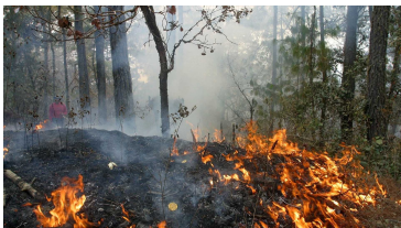
Página 3. Situación laboral de los trabajadores de SARGA