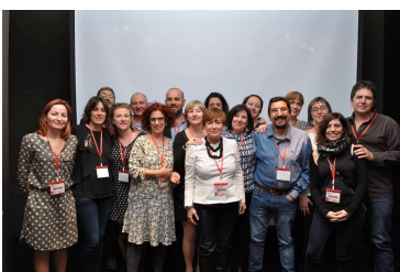
Página 2. Renovación sindical en CCOO Aragón