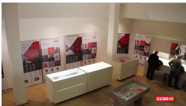
Página 4. Concluyen las conferencias de "50 años de CCOO"